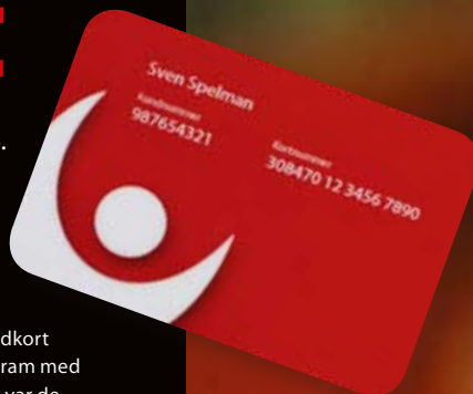
Utveckling antal spelkortsregistrerade kunder

Idag går Spelkortet inte att använda vid köp av lotter via andra kanaler än svenskaspel.se. Det gäller inte heller när man spelar på Vegas-automaterna eller på kasinona. Så länge Svenska Spels bingohallar är i drift kan Spelkortet erhållas även där och är obligatoriskt vid spel på bingoterminaler.